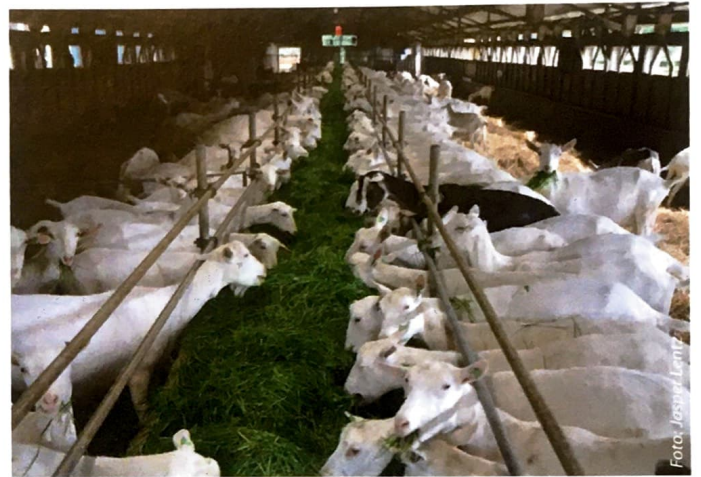
Op de centrale voergang krijgen de 400 geiten vers gras.

N et buiten Leersum (provincie Utrecht) ligt landgoed Zuylestein. Een paar honderd meter buiten de dorpskern loopt een onverharde weg naar het bedrijf van familie De Lange. De onverharde weg gaat over in een verharding tussen de woning en de stal door. Het woonhuis, de stal ernaast en de geiten in de wei vormen een pittoresk plaatje. De mechanisatie die gereed staat voor de graswinning en het voeren gaat al wat jaren mee en maakt het pittoreske beeld compleet. De boerderij is sinds 1966 in de familie.